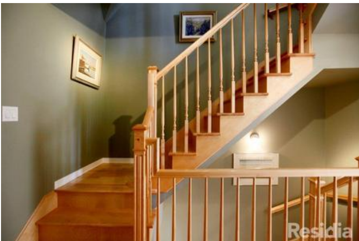
Escaliers de bois