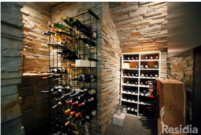
Cave à vin